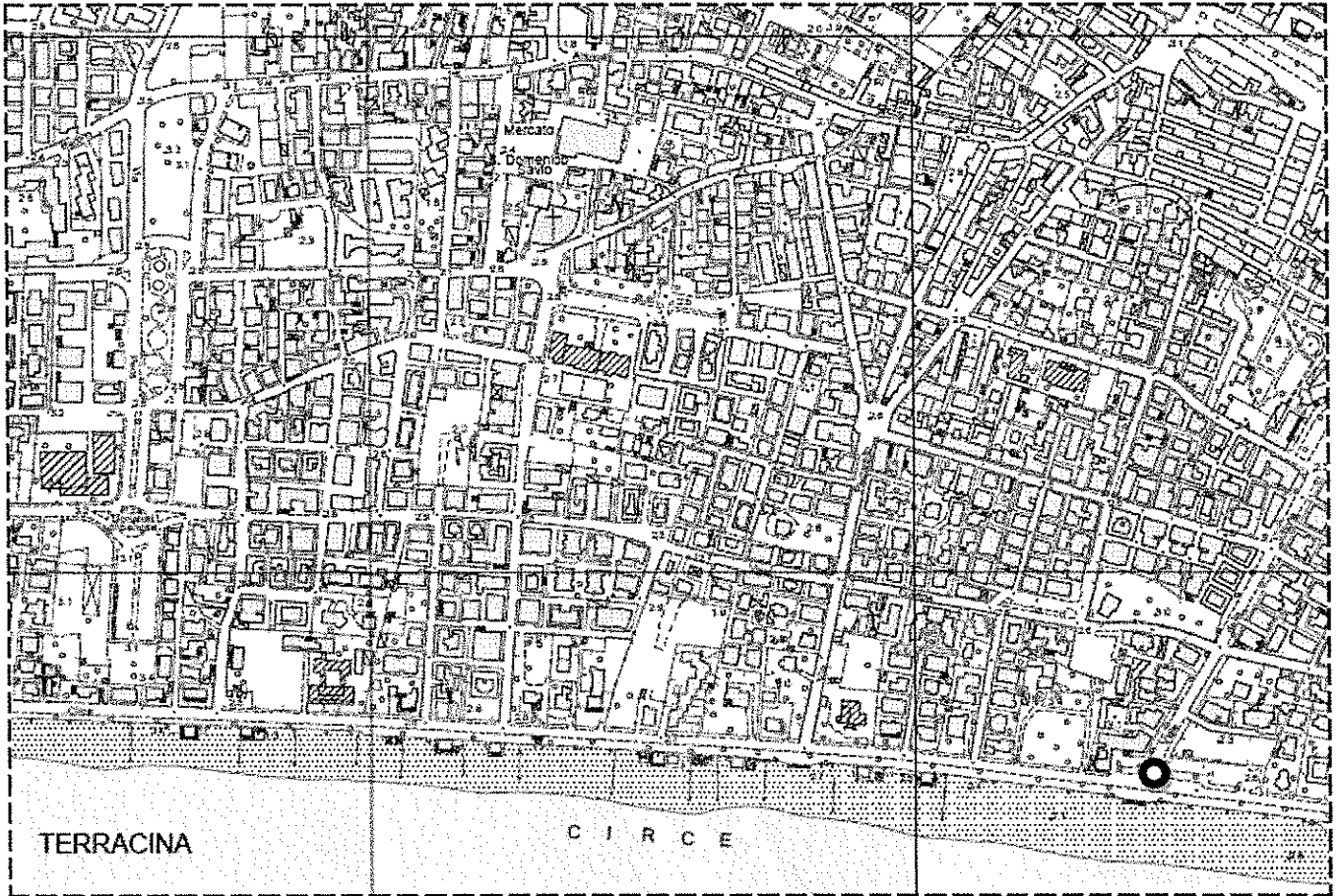
● Piazzale Aldo Moro (ex "Piazzale Lido")