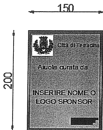
CARTELLLO TIPO 2