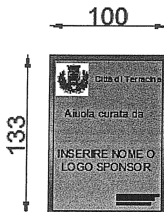
CARTELLLO TIPO 3