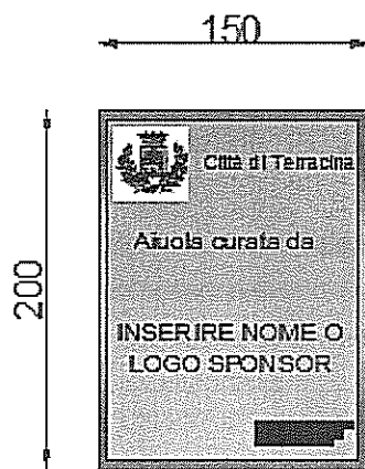
CARTELLO TIPO 2