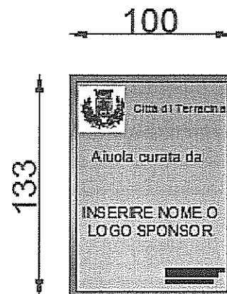
CARTELLO TIPO 3