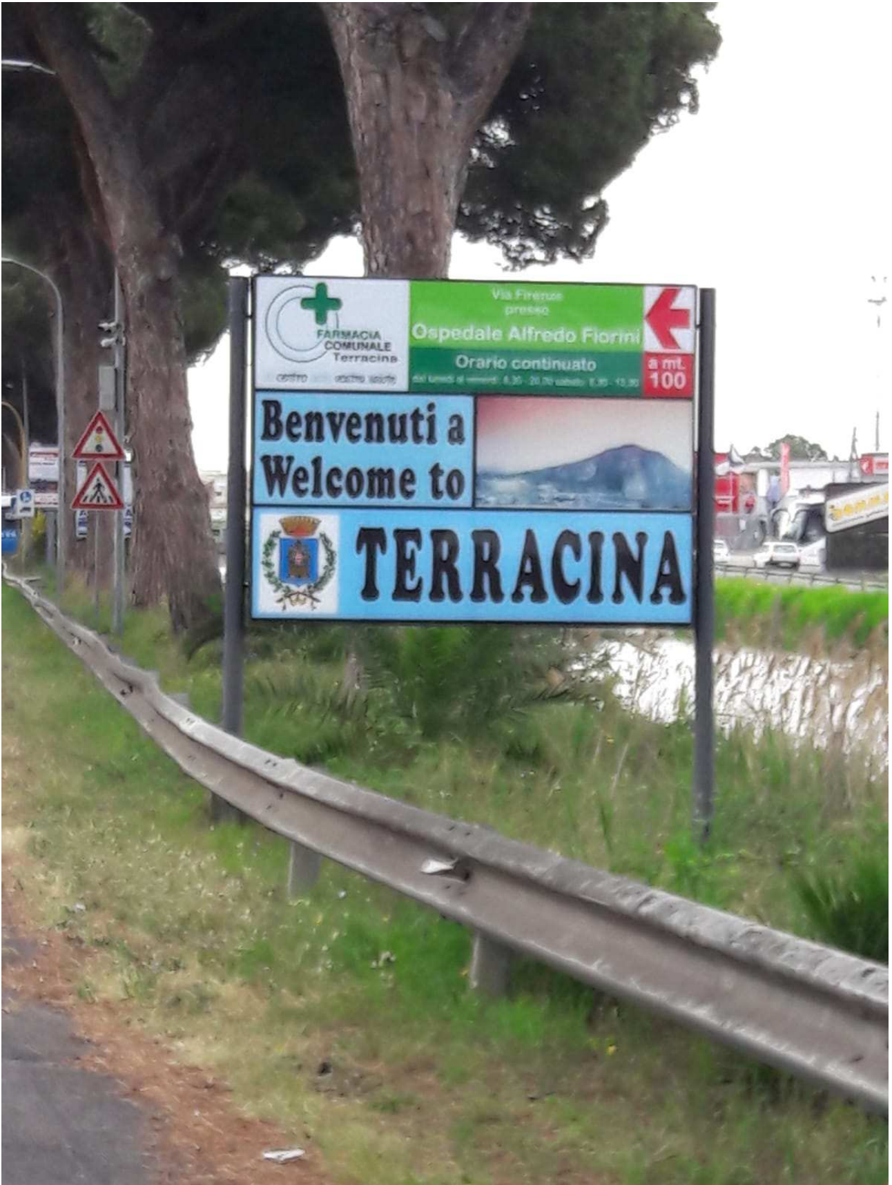
quadro turistico (tipologia 2)