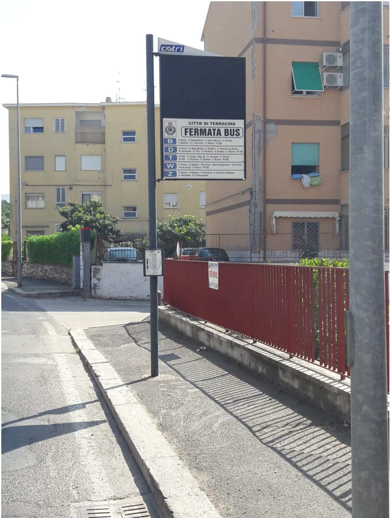
Palina (tipologia 1)