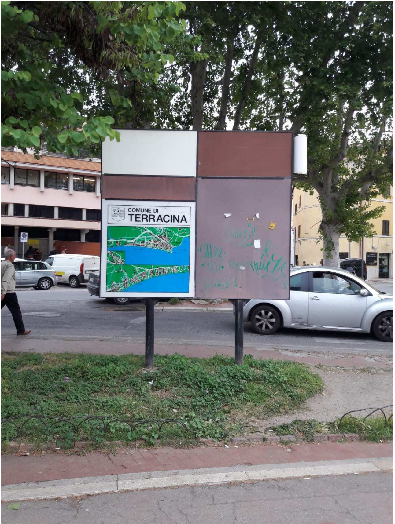
Quadro turistico (tipologia 1)