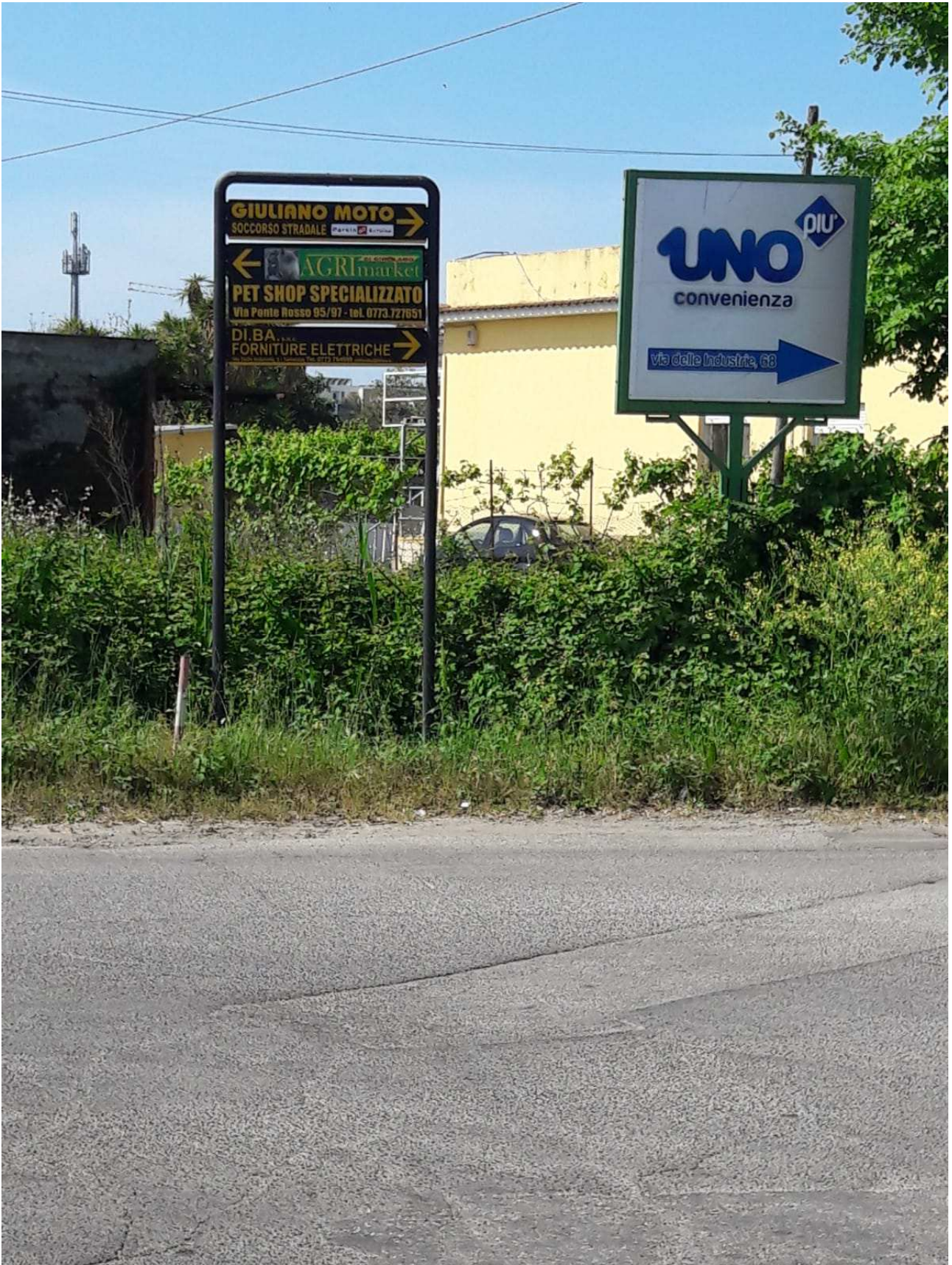
Freccia (tipologia 1) dimensioni varie