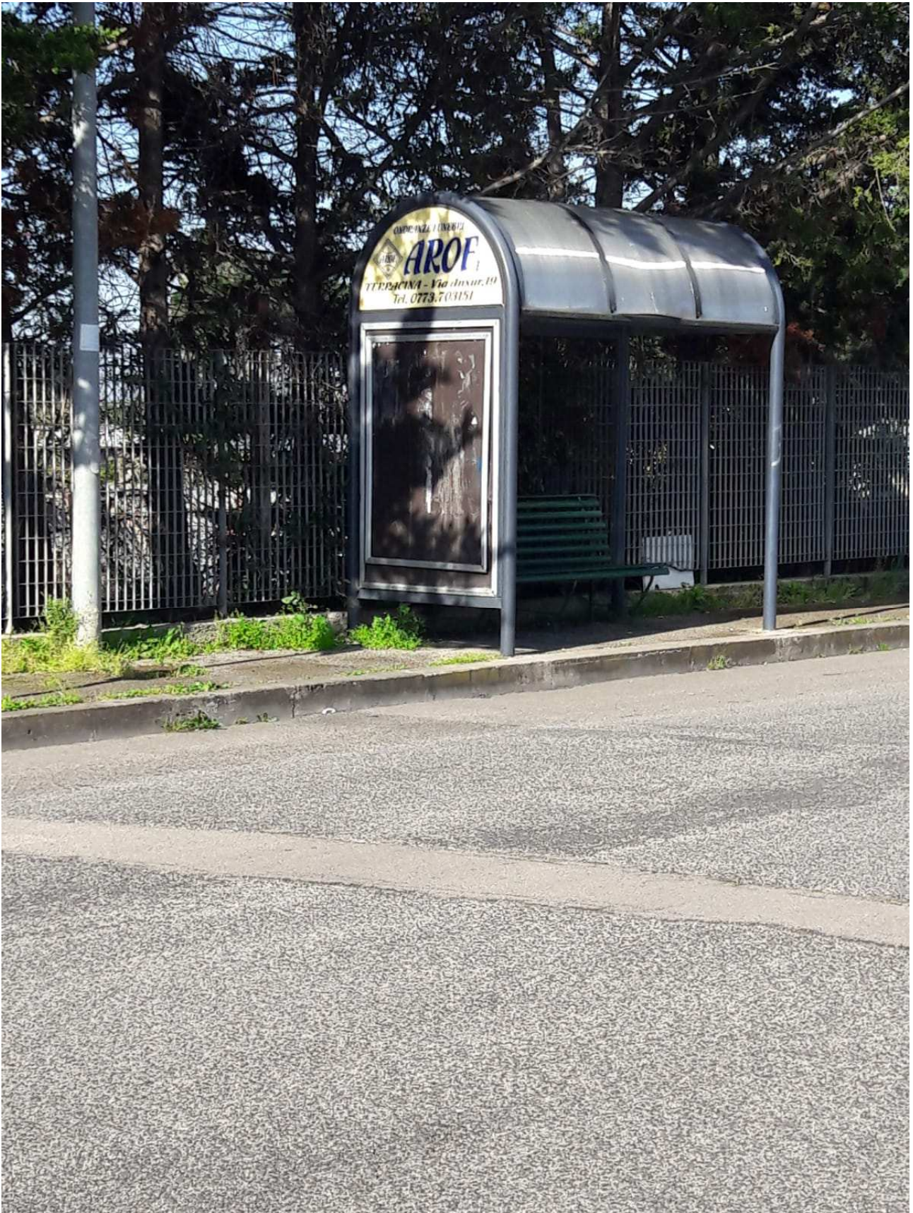
Pensilina (tipologia 6)