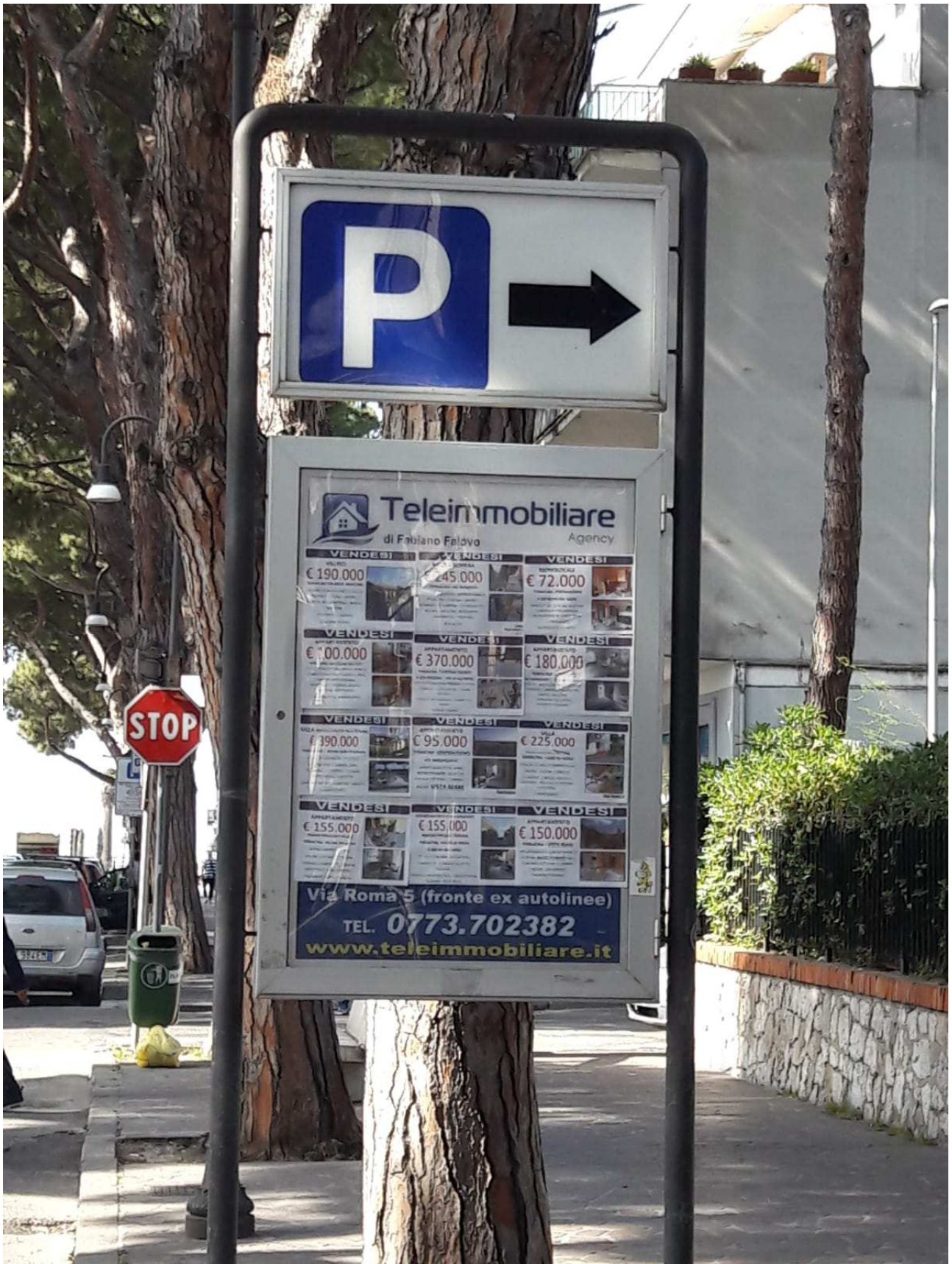
Segnalatore - dimensioni varie