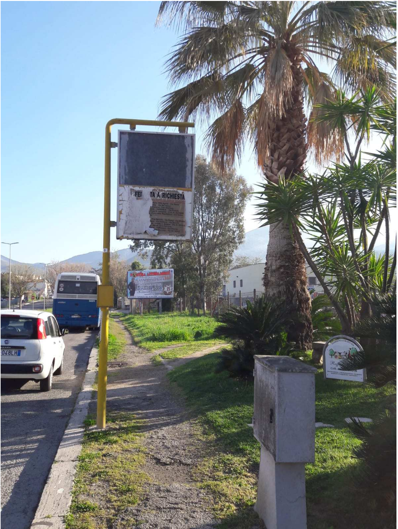
Palina (tipologia 2)