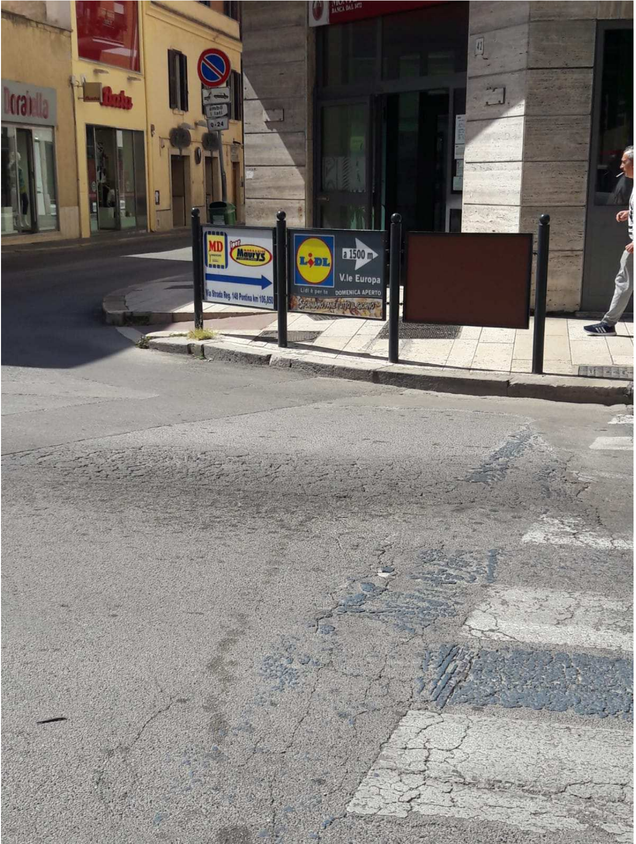
Transenne (tipologia 1) dimensioni varie