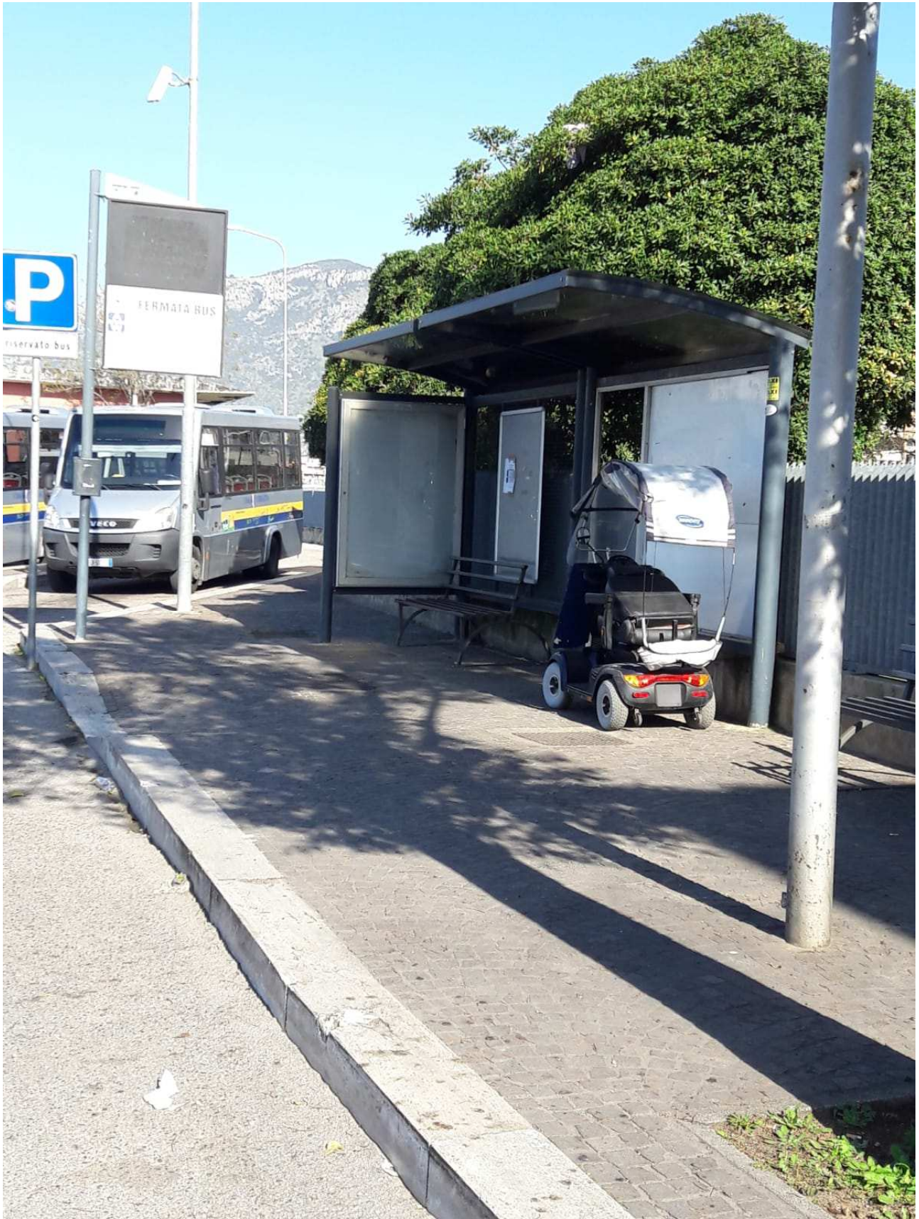
Pensilina (tipologia 5)