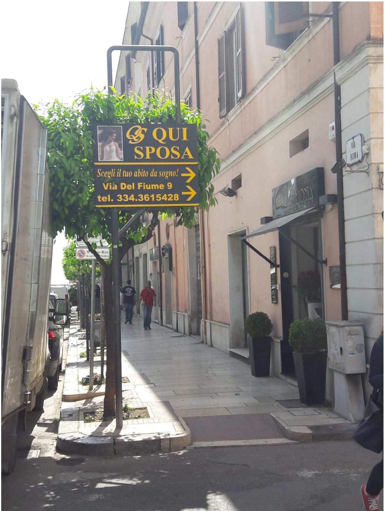
Freccia (tipologia 2) dimensioni varie