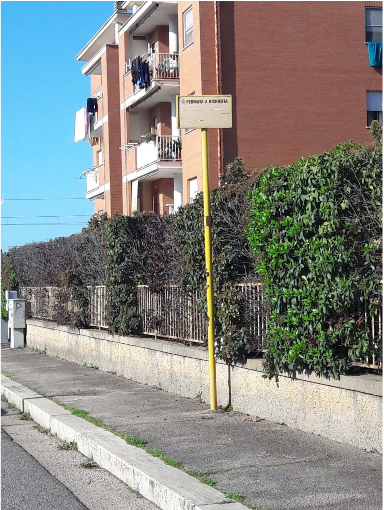
Palina (tipologia 4)