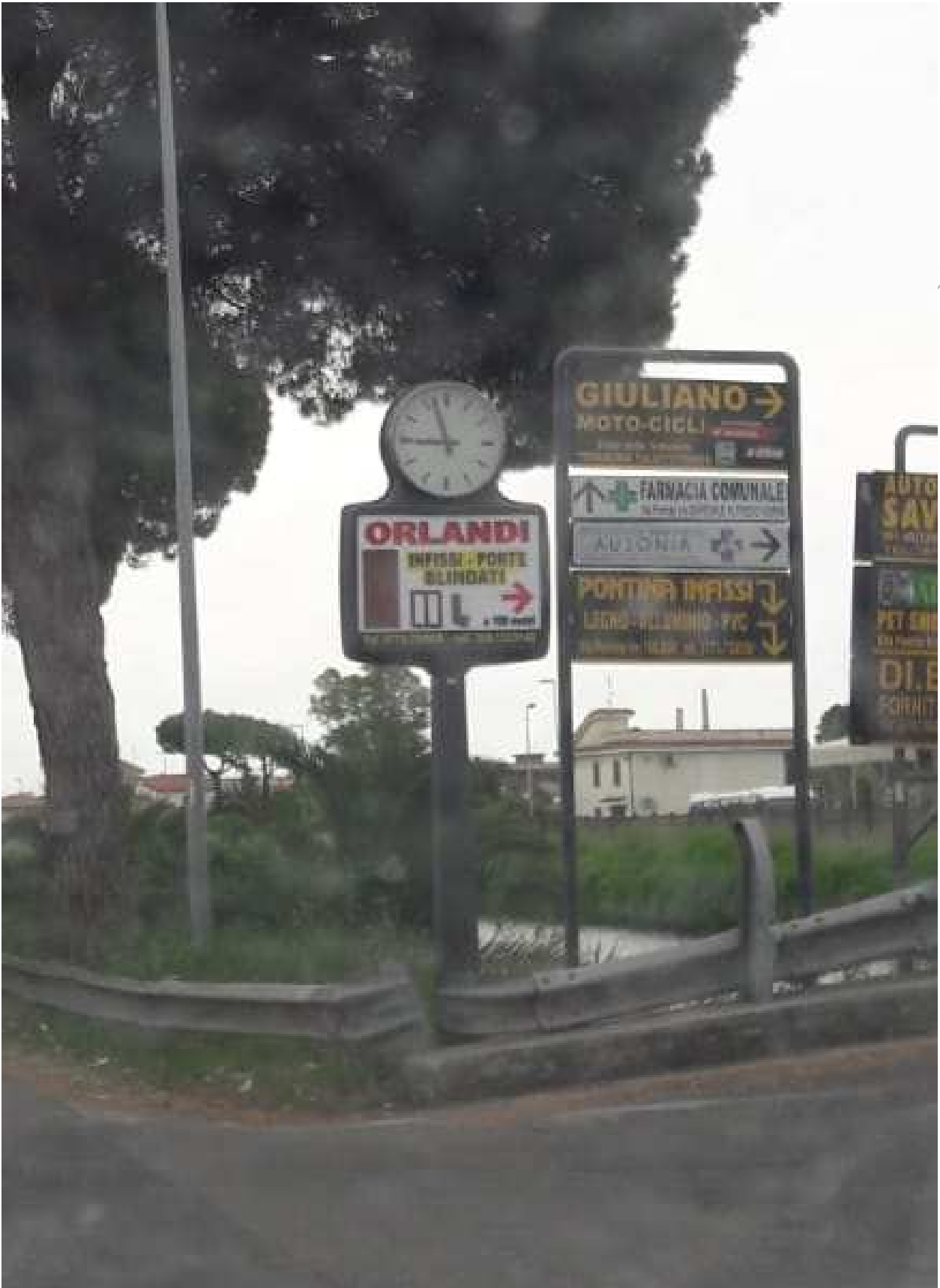
Orologio (tipologia 2)