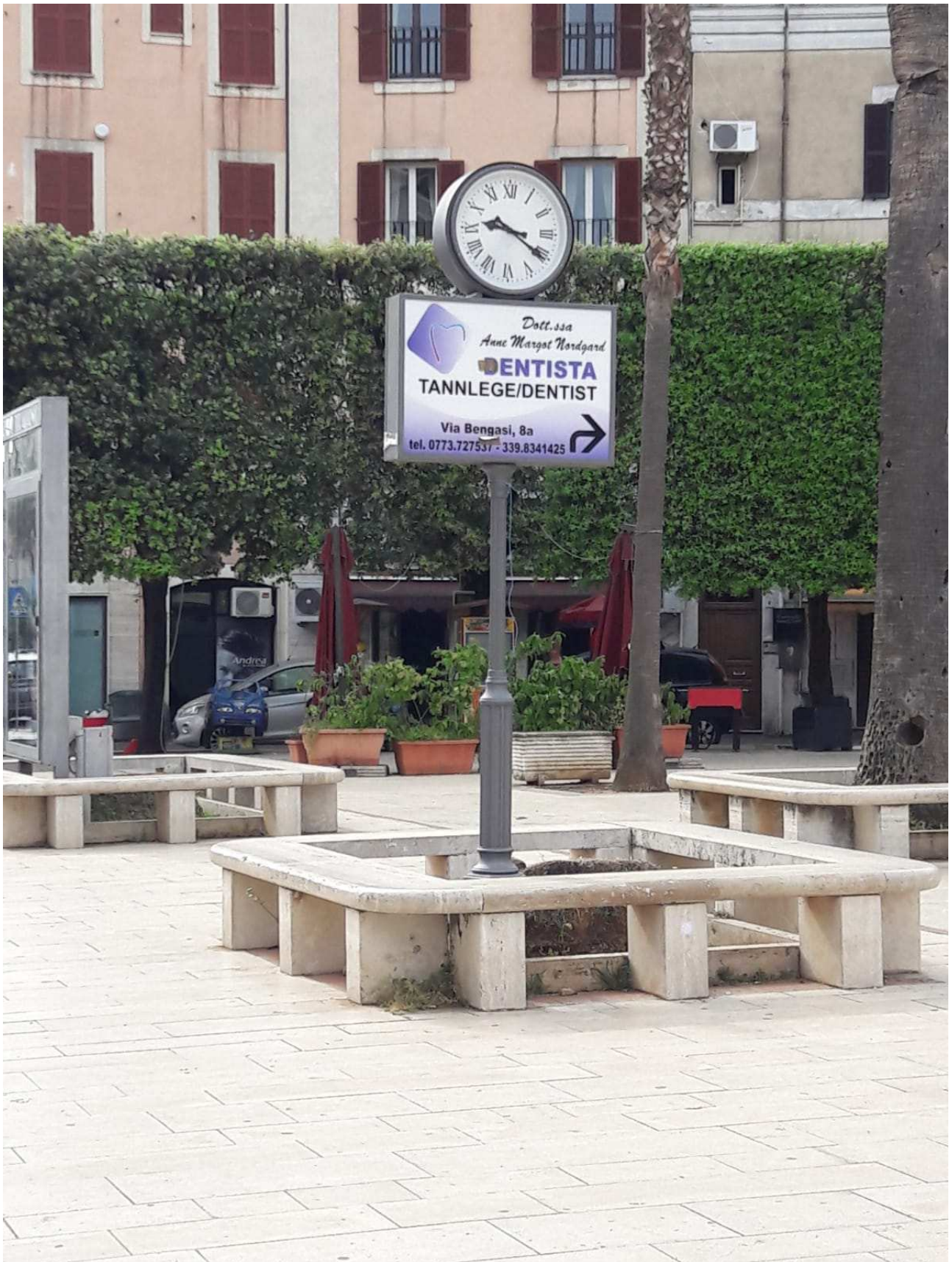
Orologio (tipologia 1)