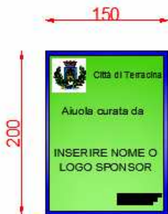
CARTELLO TIPO 2