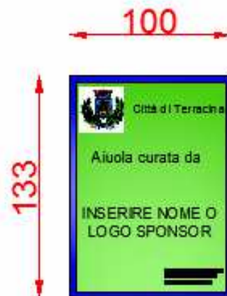
CARTELLO TIPO 3