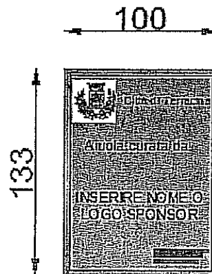
CARTELLO TIPO 3